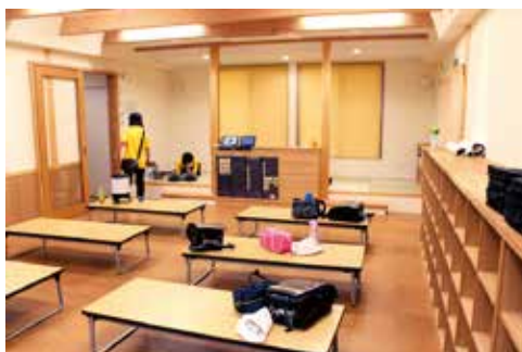
おやつを食べたり、 友だちと遊んだりするプレイルーム