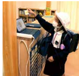
入退館管理は、 IDカードをタッチします