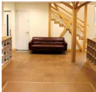
広々とした玄関スペースで 子ども達を迎えます