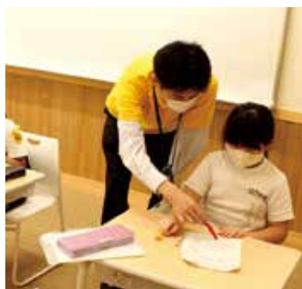
2Fには学習室が3つあります