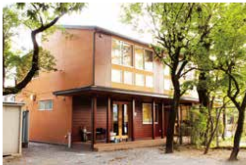
学童棟「なかよし学習館」