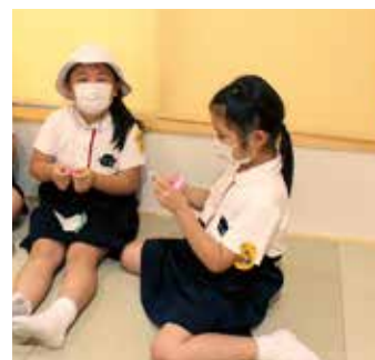
のんびりと過ごせる畳スペース